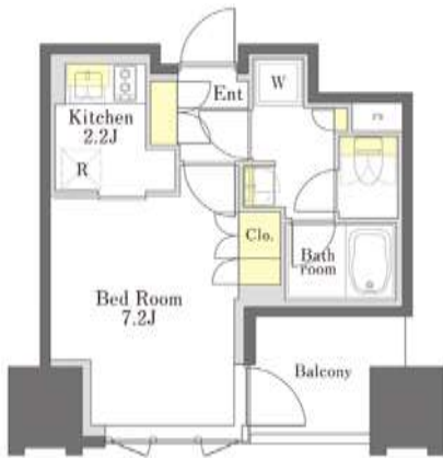
1K: 26.4 m 2 (D タイプ)

キッチン、バスルーム、トイレをそれぞれ独立させた機能的な単身者向けの間取りです。