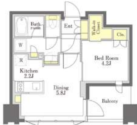
1DK: 32.9 m 2 (E タイプ)

キッチン、バスルーム、トイレをそれぞれ独立させた機能的な単身者向けの間取りです。