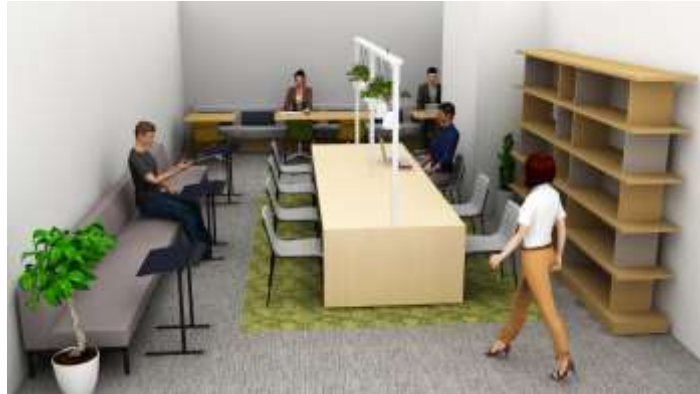
ワークラウンジイメージ

「仕事に集中したい」「気分を変えて自宅以外で勉強したい」といった多様な働き方・ライフスタイルに対応が出来る共用のワークラウンジを設けました。複合機・Wi-Fiを完備し、株式会社 KOKUYO による空間コーディネートにより機能的で利用しやすい空間となっています。