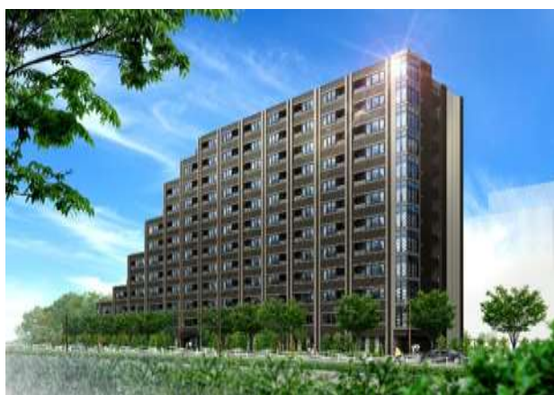
建物外観完成イメージ