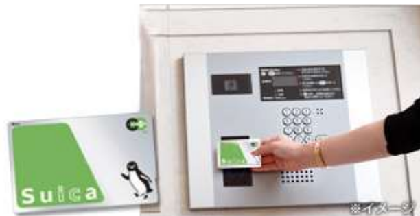
Suica 他交通系 IC カード入退室管理システムイメージ

※3 セントリックは、東日本旅客鉄道株式会社、JR 東日本メカトロニクス株式会社、セントラル警備保障株式会社の共同開発したシステムです。