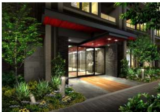
建物エントランス完成イメージ