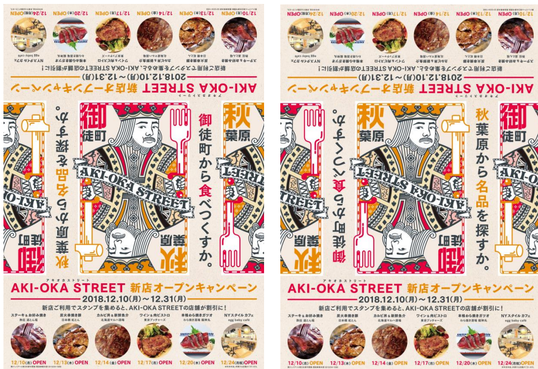
(秋葉原からでも、御徒町からでも、街歩き出来ることをイメージしたポスターデザイン)

つきましては、この新店開業に合わせ、「AKI-OKA STREET」各店で使える特典が“もれなく貰える”、スタンプキャンペーンを開催し、マップ片手に街歩きを楽しんで頂きながら、地域と共存する明るい高架下を目指して参ります。