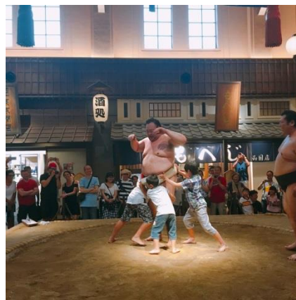
過去の相撲パフォーマンスの様子