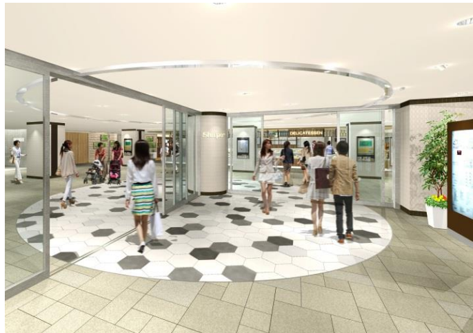
<本館1階：改札口エントランスイメージ>

新規開業する南館の1階は、船橋海神にある老舗の地元洋菓子店“菓子工房アントレ”などが入る「 フードマーケットゾーン 」、2階から4階は、千葉初出店の人気の回転寿司店“回し寿司 活”や船橋の人気焼き肉店の新業態で、飲めるハンバーグが看板メニューの“将泰庵DINER”などが入る「 レストランゾーン 」、5階は女性専用のホットヨガスタジオ“sopra”などが入る「 サービスゾーン 」となっております。