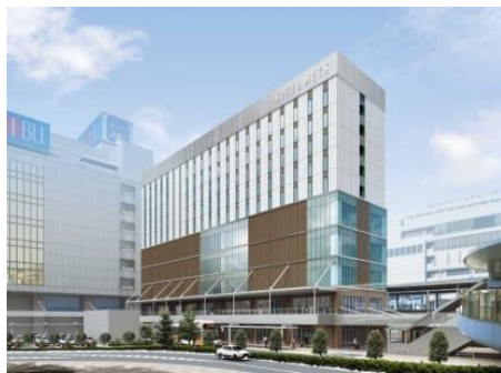
<南館：外観イメージ>