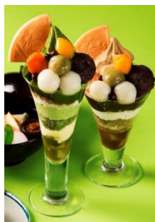
◀両国橋茶房 「両国橋抹茶パフェ」