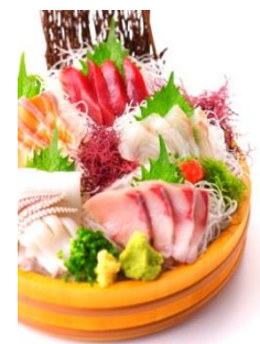
築地食堂源ちゃん▶ 「源ちゃん刺盛」