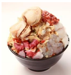
▲月島もんじゃもへじ 「海鮮もへじスペシャル」

※特典内容は予告なく変更になる場合がございます。詳しくは各店舗へお問い合わせください。