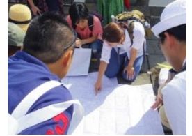
<書き込みMAPイメージ写真>

“まちあるきワークショップ”や“MAPを肴に語り合う会”など、まちを再発見するイベントを実施します。