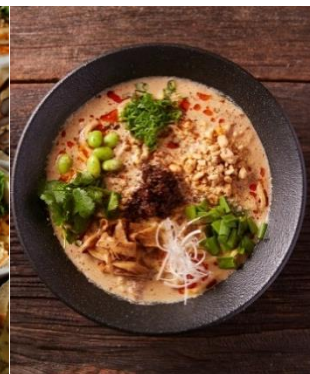
<「箸とレンゲ」商品イメージ>