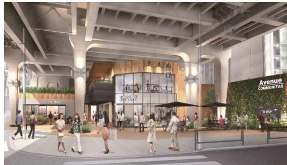
<エントランス イメージ写真>

まちとともに歩む商業施設として、まちのクリエイターたちと 阿佐ヶ谷の暮らしがさらに楽しくなるような取り組みを始めます。