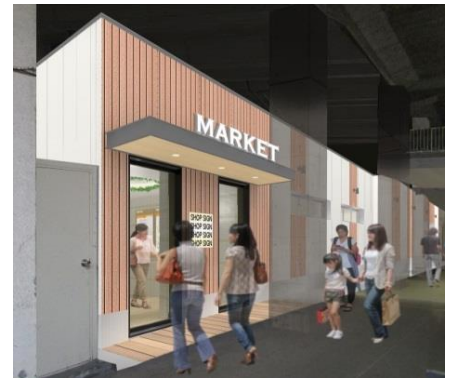
<「新鮮館」外観イメージ>