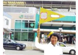
<まち歩きイメージ写真>