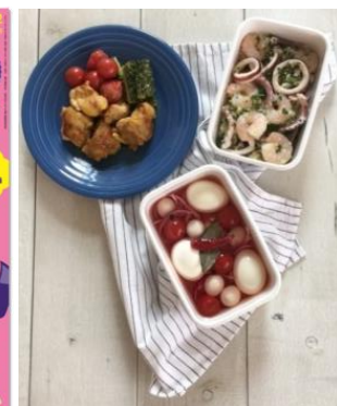
<レシピ イメージ写真>