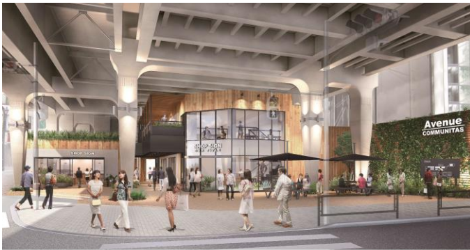
新規開発商業施設外観イメージ

株式会社ジェイアール東日本都市開発はショッピングセンター「ビーンズ」を現在12店で運営しています。このたび阿佐ヶ谷に13店目の「ビーンズ」が7月末にオープン。今回、新規の商業施設の開業、及び現「阿佐ヶ谷ダイヤ街・新鮮館」のリニューアルを行い、より魅力ある高架下に生まれ変わります。