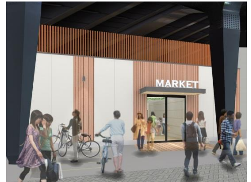
「新鮮館」外観イメージ