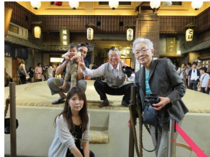
第1回土俵撮影会の様子

当日館内で2,000円以上(税込・合算可)お買い上げしたレシートを 持参の男性のお客さま(土俵に上がるのは男性のみとさせていただきます)