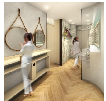
〈1階女性用トイレ内イメージ〉

会社に行く前に、デートの前に、地元の飲み会の前に、ちょっと立ち寄って気分をあげる場所。